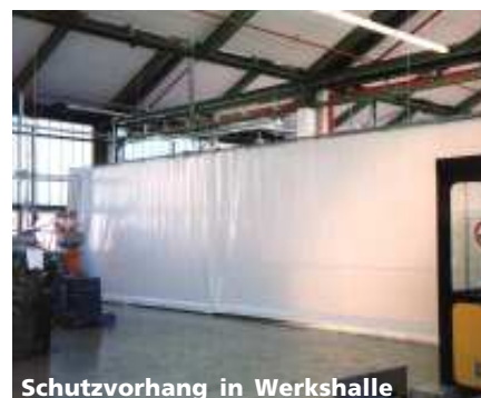
Schutzvorhang in Werkshalle