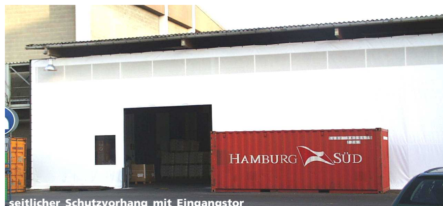
seitlicher Schutzvorhang mit Eingangstor