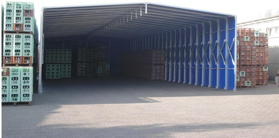
Die Planex-Zeltkonstruktion „Mobil“ - die flexible Lösung

Die faltbare Planex-Zeltkonstruktion „Mobil“ ist ideal, um überdachten Raum auf Zeit zu schaffen. Mit Höhen bis 3,20 m und Seitenlängen bis 25 m bieten wir Ihnen eine flexible Lösungen für den individuellen Bedarf. Die größte Ausführung kann problemlos z. B. mehreren Lieferwägen als Garage dienen. Die Zeltkonstruktion „Basis“ ist feststehend im Boden verankert und für den dauerhaften Einsatz geeignet.