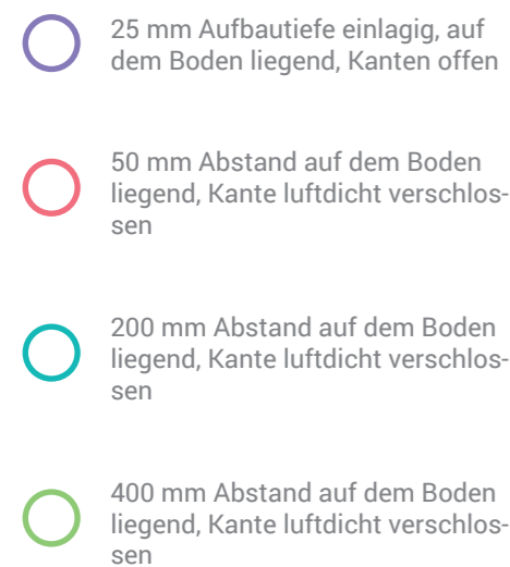
Schallabsorptionsgrad aPerf® 25