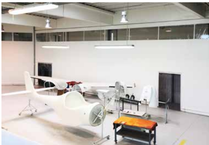
Hallenabtrennung am Flughafen, ca. 200 m 2