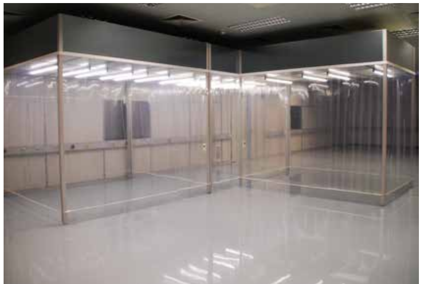
Reinraumvorhänge für Laminar Flow

Der Reinraumvorhang ist als Lamellenvorhang oder als durchgängiger Vorhang erhältlich und kann auf verschiedene Arten an der Wand oder der Decke befestigt werden.