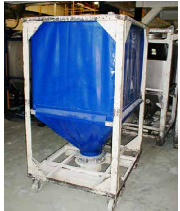
Membrane für Silobehälter