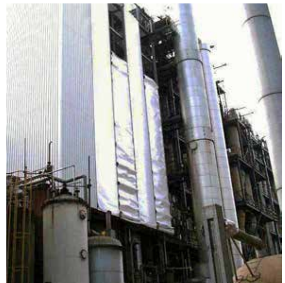
Rollplane, zum schnellen Öffnen der Fassade im Brandfall