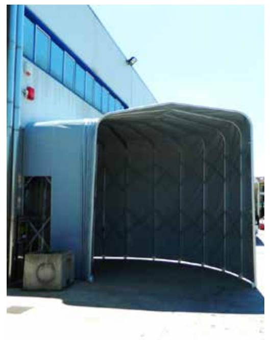
Schiebezelt als Eingangsbereich mit Kurve