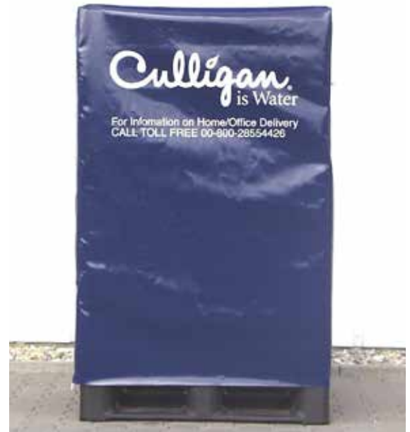
Schutzhaube nach Kundenvorgabe