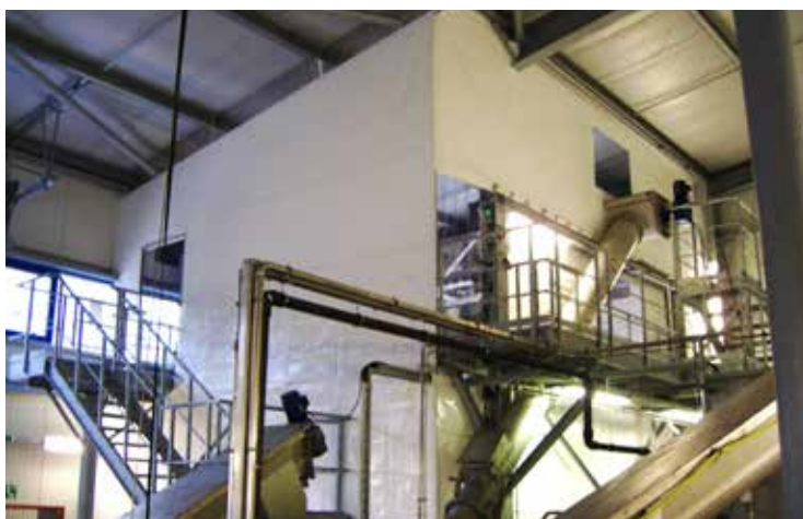
Hallenabtrennung im Anlagenbereich