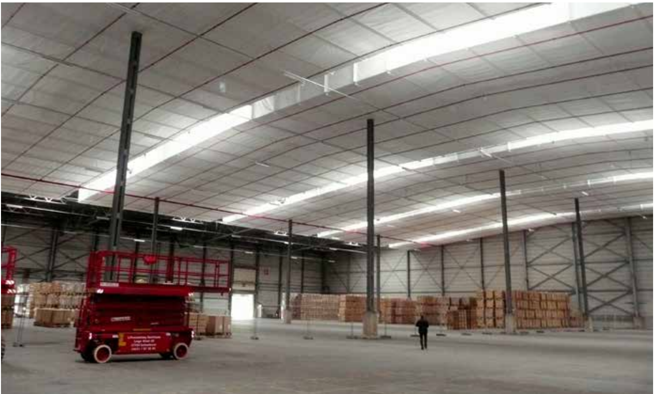
Nichtbrennbare Zwischendecke aus leichtem Glasgewebe A2