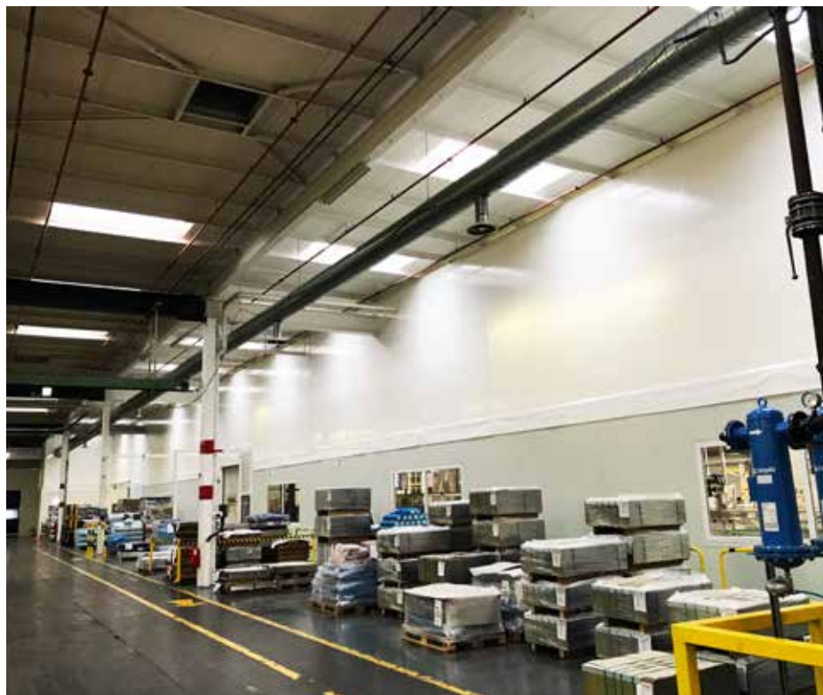
Hallenabtrennung im Produktionsbereich, ca. 350 m 2

Mit Hallenabtrennungen und Streifen- vorhängen können Sie Hallen schnell und flexibel in einzelne Arbeitsbereiche einteilen. Das spart beispielsweise Heizkosten, schützt vor Lärm oder neugierigen Blicken. Streifenvorhänge trennen ab, ohne die Sicht zu behin- dern und werden damit Sicherheitsan- forderungen gerecht.