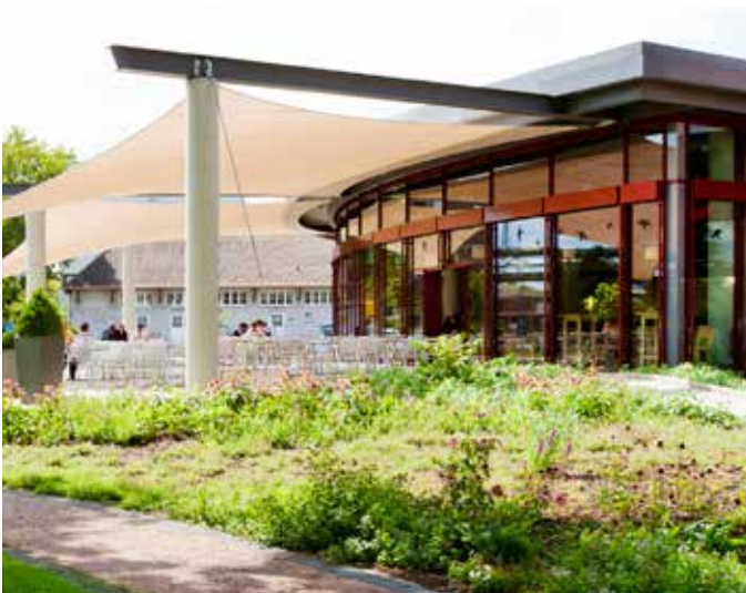
Beschattung vor Betriebskantine

Benötigen Sie weitere Informationen zu unseren maßgeschneiderten Produkten oder haben Sie ein konkretes Projekt?! Wir beraten Sie gerne.