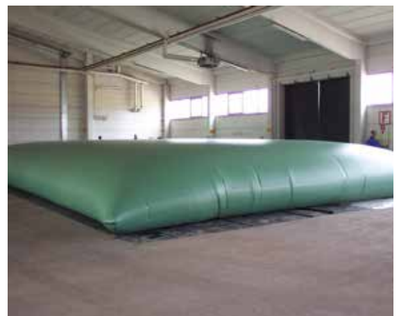
Selbsttragender, flexibler Tank für die Speicherung von Flüssigkeiten

Vielleicht benötigen Sie ein Produkt, an das wir noch nicht gedacht haben? Gerne verwirklichen wir Ihre Ideen!