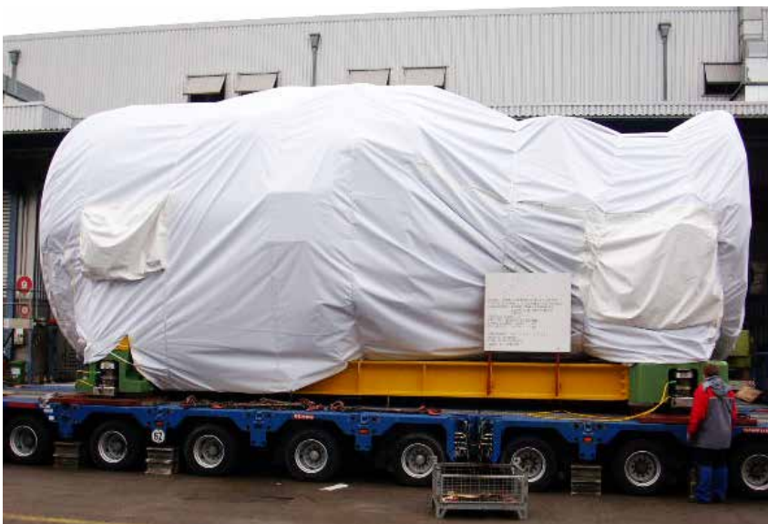
Schutzhaube, z. B. für Schwerlasttransporte