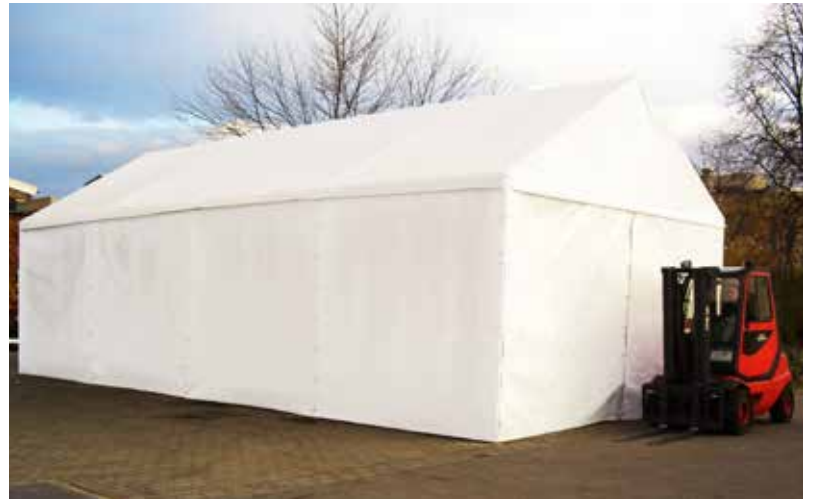
Systemzelt als Lagerzelt

Zelte von Planex werden nach Ihren Vorgaben gefertigt. Die robuste Systembauweise unserer Produkte ermöglicht Ihnen völlig neue Freiheiten.