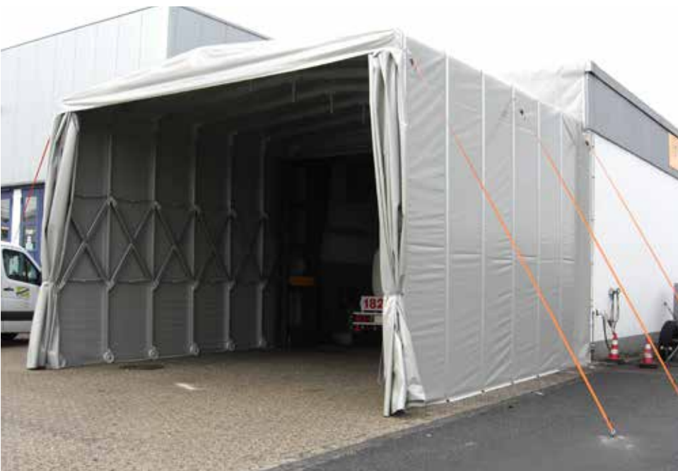
Schiebezelt als Hallenerweiterung