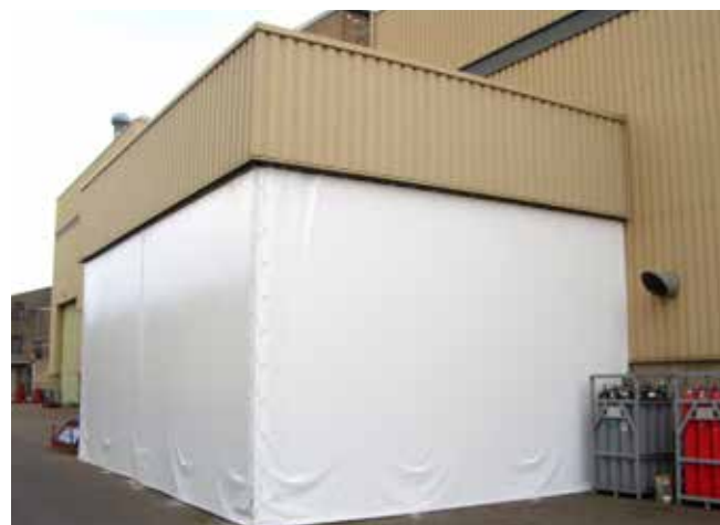
Hallenabtrennung im Lagerbereich